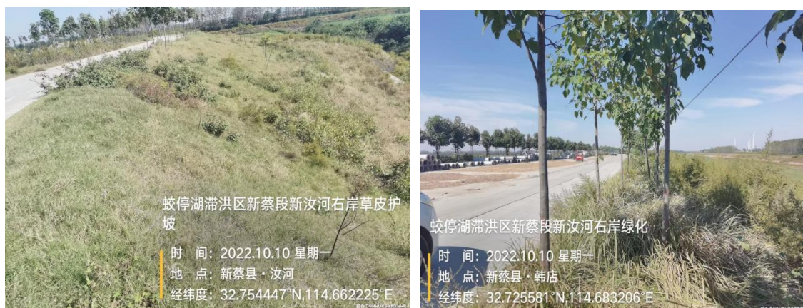
图 6.3-1 水土保持措施落实效果照片