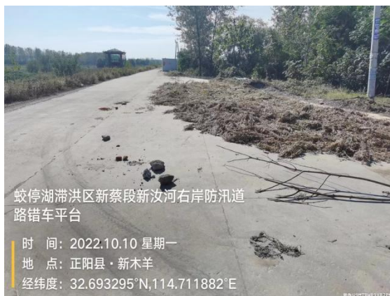
新汝河右岸及错车平台