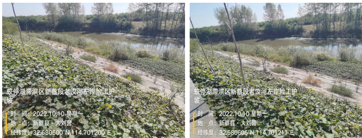
老汝河左岸险工护坡