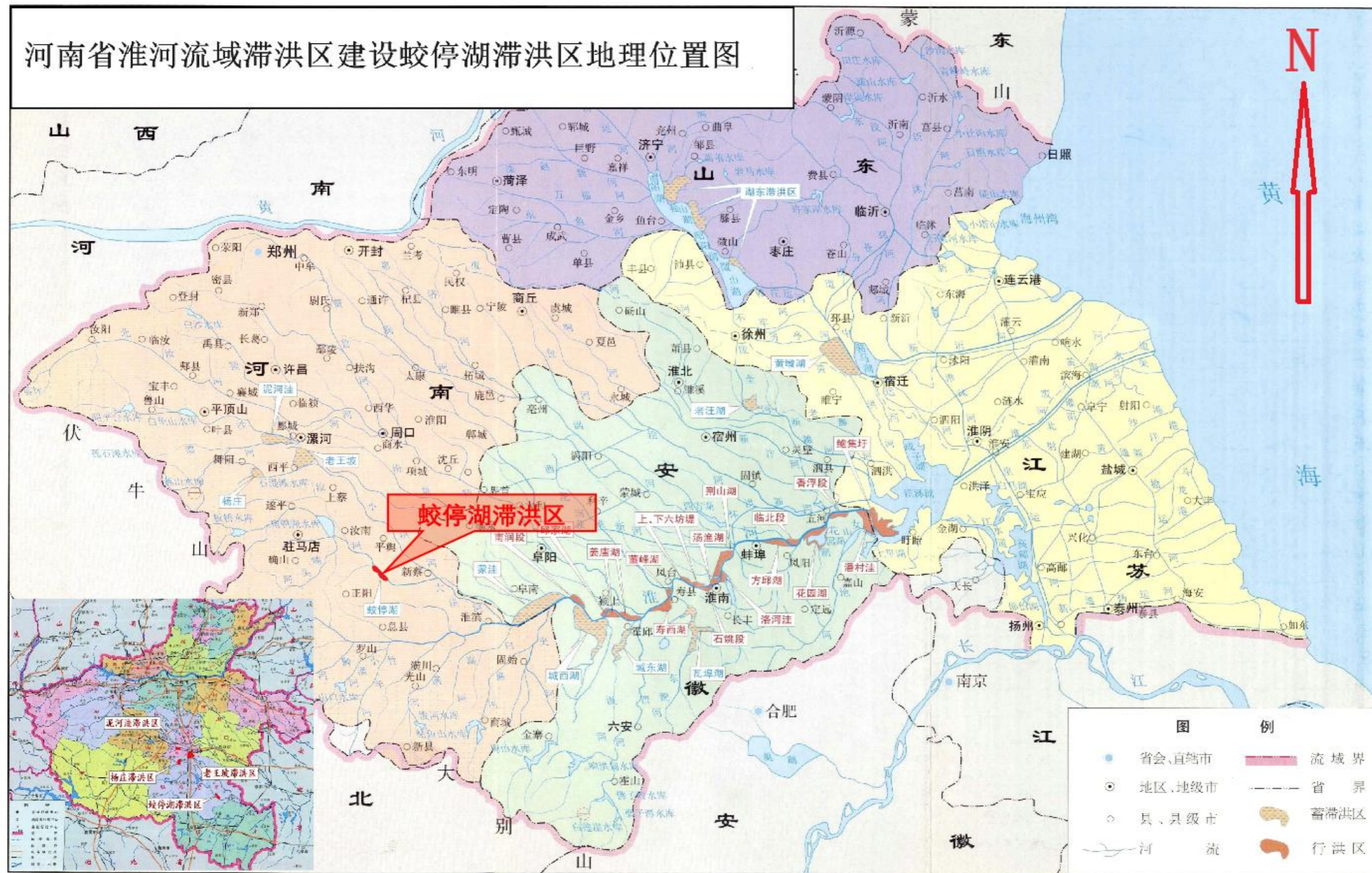
附图1: 河南滞洪区及本工程地理位置图