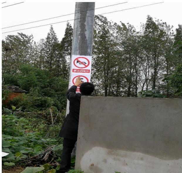
图 8.2-1 噪声防治措施照片

(3) 各施工标段合理的安排了施工时间，禁止在夜间 10:00 至凌晨 6:00 区间施工。