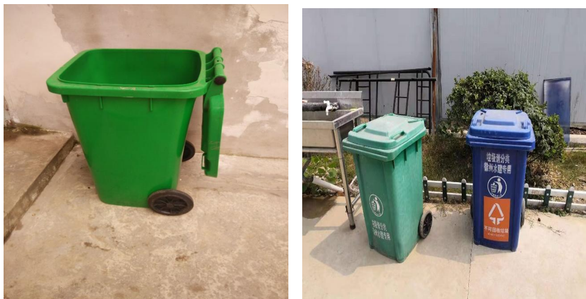
图 8.2-1 施工生活营地配备的垃圾桶照片