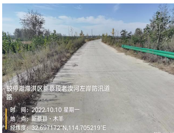
老汝河左岸撤退道路