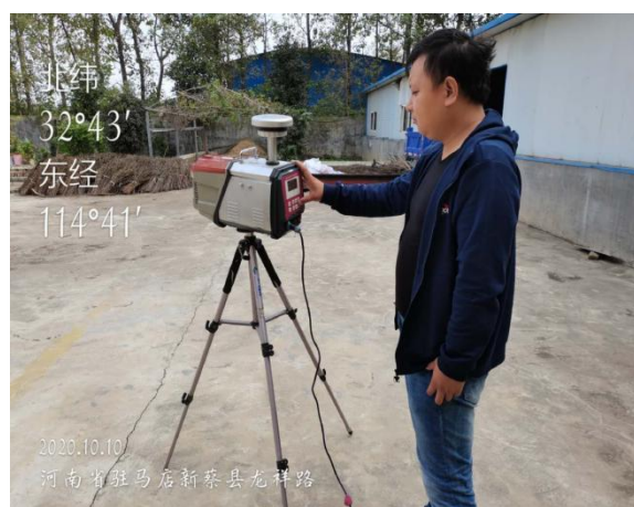
大气环境质量监测