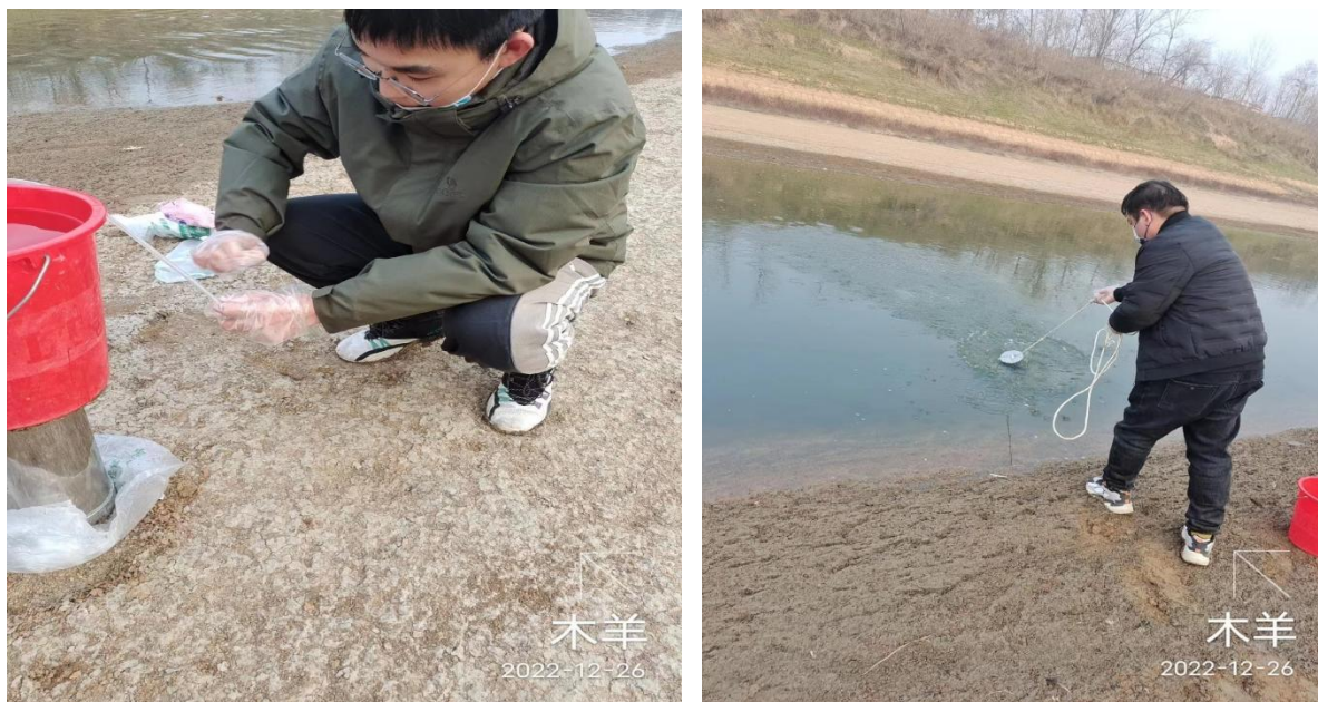
图 10.2-2 部分验收期环境监测照片